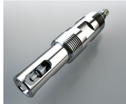
Sensoradaption von Ø12mm PG13.5 für Installationen mit NPT-Gewinden