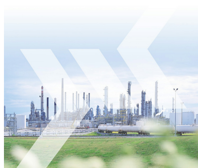
Optimal einsetzbar in industriellen Anwendungen